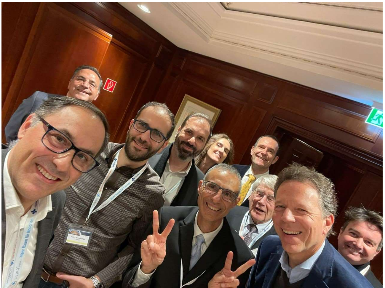
Am Rande der Veranstaltungen tagten gut gelaunte Teilnehmer von IFDAS – International Federation og Dental Anesthesiology – und EFOSS - European Federation of Oral Surgery Societies.